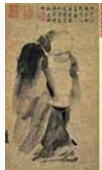
潑墨仙人圖( 梁楷 作·南宋時代)·13世紀·国宝