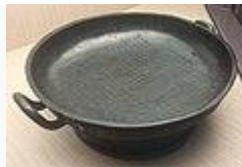
散氏盤(西周時代)・前 9 世紀・国宝