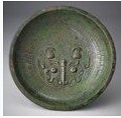
蟠龍紋盤(殷時代)・約前 14 世紀 - 前 11 世紀頃・国宝