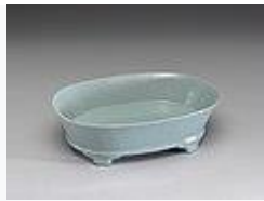
汝窯青磁無紋水仙盆(北宋時代)・約 1086 年 - 1106 年頃・国宝