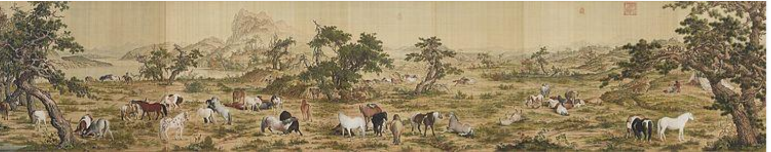
百駿图(郎世寧作·清時代)・1728 年・国宝