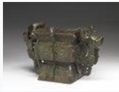
亜醜方簋(殷 - 西周時代)・約前 14 世紀 - 前 10 世紀頃・国宝