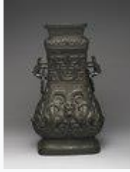
頌壺(西周時代)・前 9 世紀・国宝