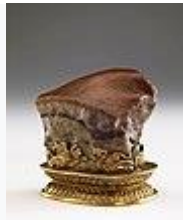
肉形石(清時代)・17 世紀・重要文化財