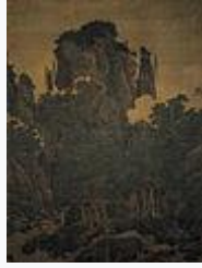
万壑松風圖(李唐作·北宋時代)·1124年·国宝