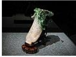
翠玉白菜(清時代)・19 世紀・重要文化財