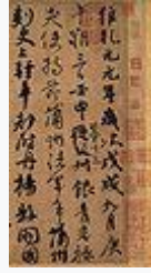
祭姪文稿 (部分) (顏真卿筆·唐時代)·758年·国宝