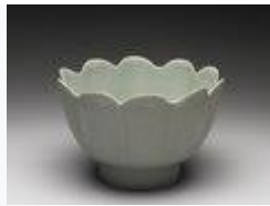
汝窯青磁蓮花式温碗(北宋時代)・約 1086 年 - 1106 年頃・国宝