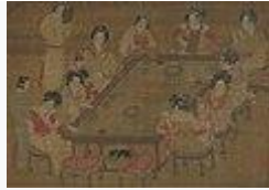
宮樂圖 (唐時代)·約 836年 - 907年頃·国宝