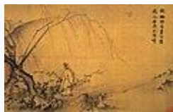
山徑春行圖( 馬遠 作·南宋時代)·13世紀·国宝