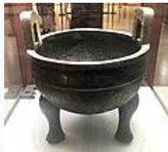
毛公鼎(西周時代)・前 9 世紀・国宝