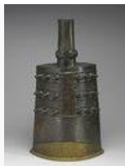
宗周鐘(西周時代)・前 9 世紀・国宝