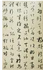
書譜(部分)(孫過庭筆・唐時代)・687 年・国宝