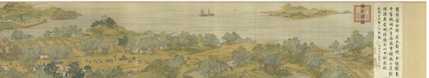
清院本 清明上河图(清時代)・1736 年・国宝