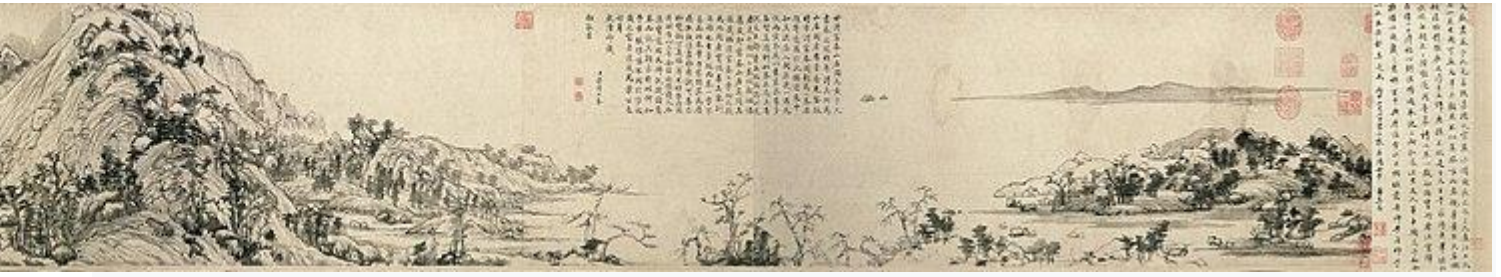
富春山居图(黄公望作·元時代)・約 1347 年 - 1350 年・国宝