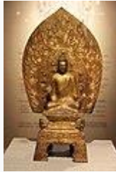
青銅鍍金釋迦牟尼佛坐像(北魏時代)・477 年・国宝